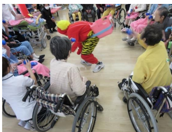
クリスマス会や節分の様子