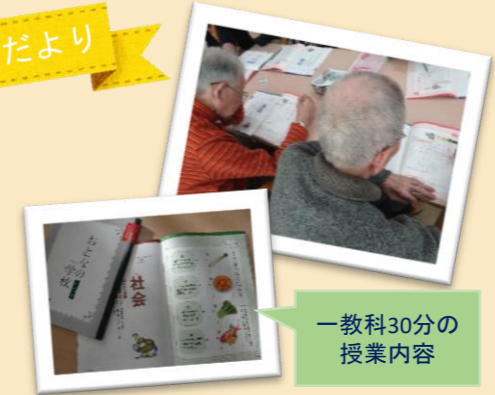
一教科30分の授業内容

デイサービスのプログラムの一環として「学ぶ」をテーマにした「おとなの学校」を始めました。国語 算数 理科 社会 体育 音楽等 授業内容も本格的です。