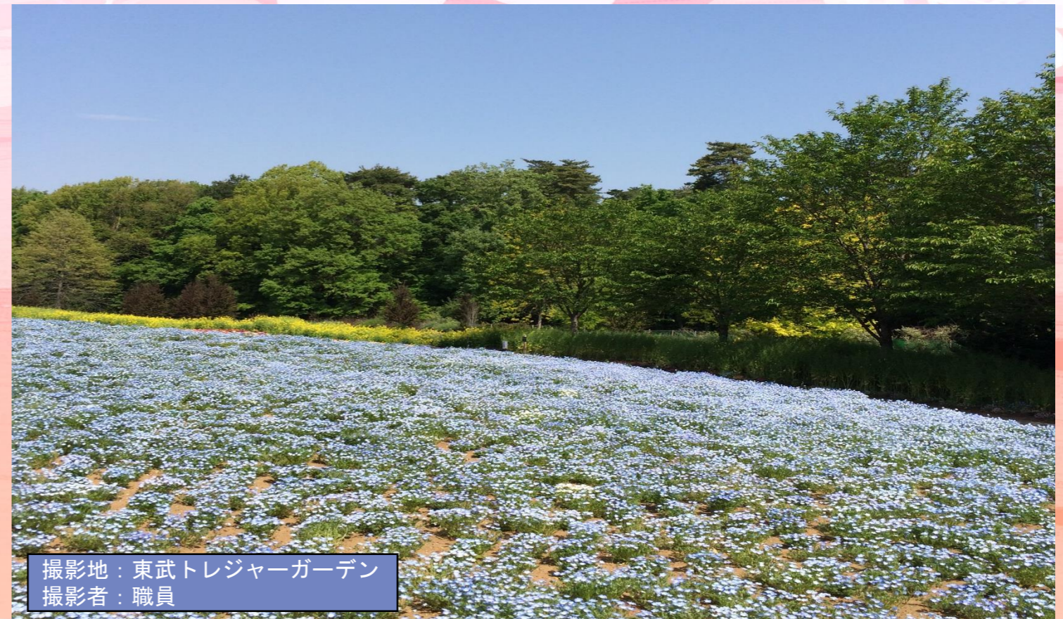
撮影地:東武トレジャーガーデン 撮影者:職員