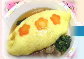
レシピ監修:鶴川リハビリテーション病院 栄養科